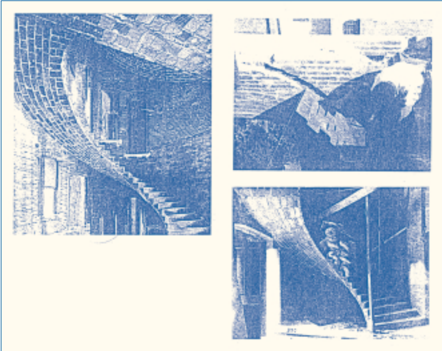
Lámina 1. Construcción y ejemplos de bóvedas tabicadas.

tablas de cálculo que simplificaran el trabajo práctico.