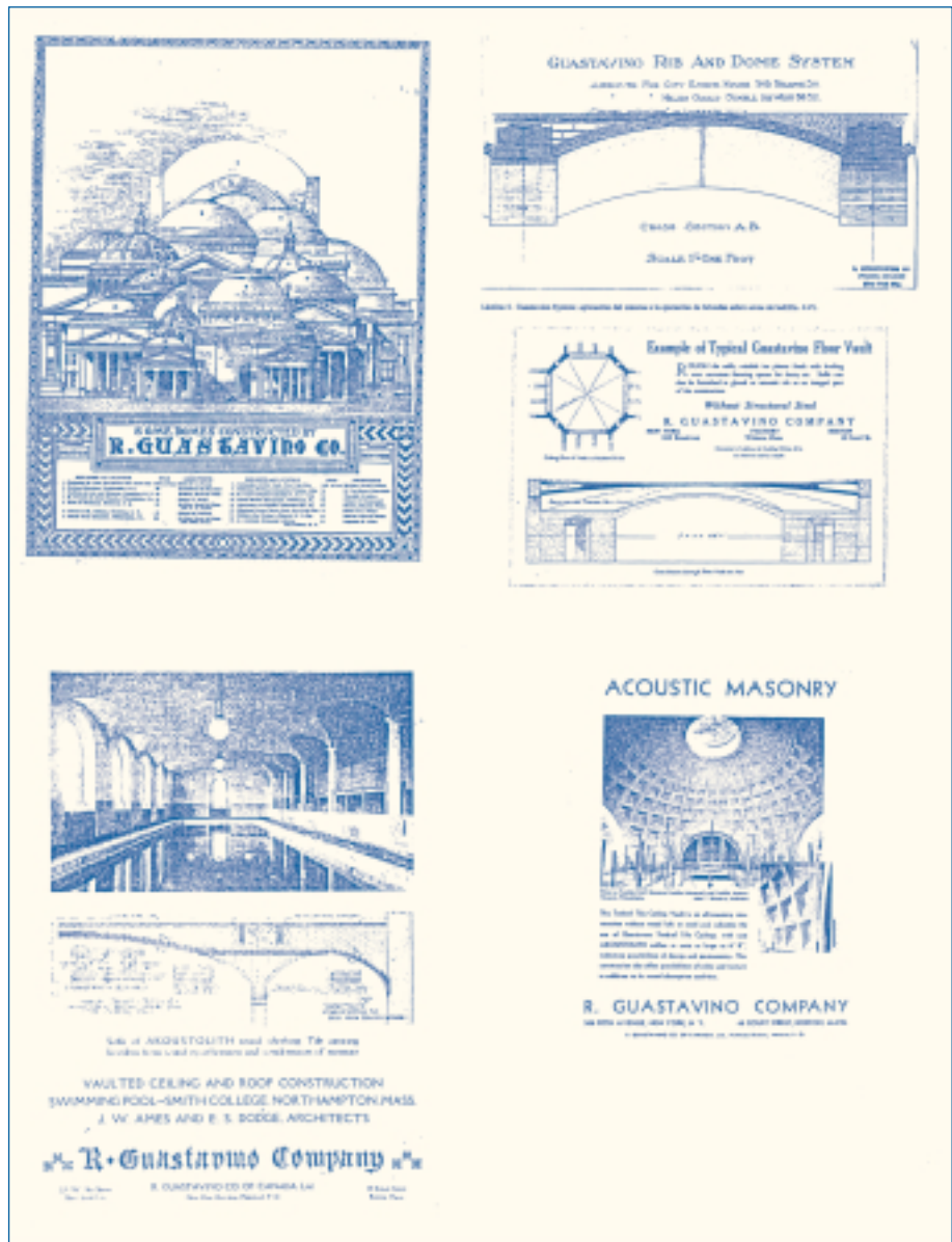
Lámina 2. Ejemplos de la publicidad de la Guastavino Co.

Desde el primer momento sintió Guastavino la necesidad de dotar a sus construcciones tabicadas