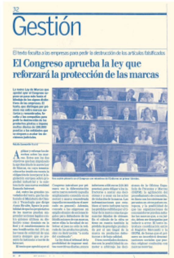
Diario CINCO DÍAS.

— Otorgamiento expreso al titular de la marca del