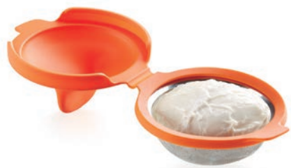
Escalfador de huevos