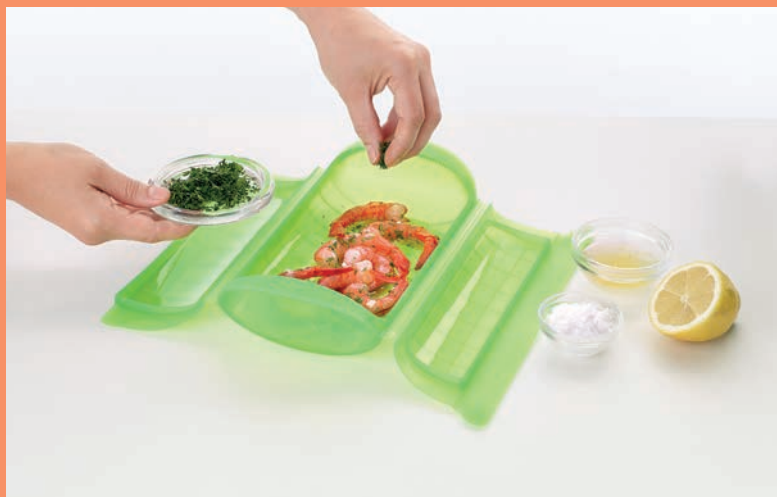
Estuche de Vapor